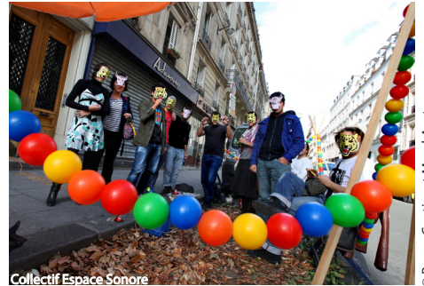
Collectif Espace Sonore