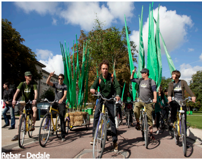
Rebar - Dedale